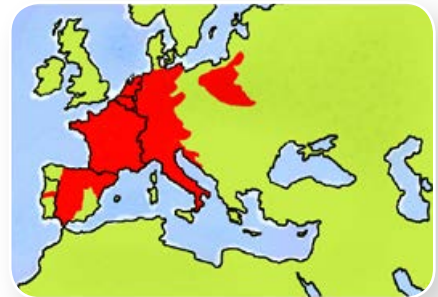
Het rijk van Napoleon.

In 1799 wordt Napoleon Bonaparte de leider van Frankrijk. Hij wil een groot Frans rijk stichten. Daarom voert hij veel oorlogen. En hij zorgt voor verbeteringen. Overal gelden dezelfde wetten.