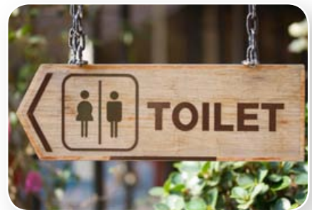
Toiletten zijn voorzieningen.