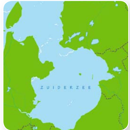
Vroeger was het IJsselmeer een zee.