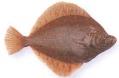
De ogen van de platvis zitten allebei aan dezelfde kant.

Alle vissen hebben kieuwen. Daarmee halen ze zuurstof uit het water. De huid van een vis bestaat uit schubben. Daardoor kan de vis sneller zwemmen. De staartvin is haar motor, de rugvinnen gebruikt ze om te sturen. Sommige vissen kunnen alleen in zout water leven. Dat zijn zoutwatervissen, zoals de haring en de haai. Andere vissen kunnen alleen in zoet water leven. Dat zijn zoetwatervissen, zoals de karper en de snoek. Er zijn ook vissen die in brak water leven. Brak water is een mengsel van zoet en zout water. De bot leeft in brak water. Het is een platvis. Als hij op zijn zij op de bodem ligt, is hij helemaal plat.