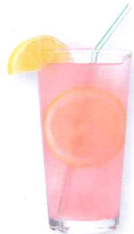
Siroop lost op in water.

Ijzer is zwaarder dan water. Een brok massief ijzer zal in water zinken. Als het ijzer van binnen hol is, zoals een schip, blijft het drijven dankzij de lucht die erin zit. Als er niet meer genoeg lucht in de holle ruimte zit, zinkt het schip. De scheepswand moet daarom sterk genoeg zijn, zodat hij niet scheurt. In de toekomst kunnen we schepen bouwen met een dubbele scheepswand. Daarin zitten een soort airbags die zich met lucht vullen als er een gat in de scheepswand komt. Dan blijft het schip toch nog drijven. Moderne reddingsboten kunnen ook niet zinken. De bovenkant draait altijd vanzelf weer boven water. Net als een tuimelaar.