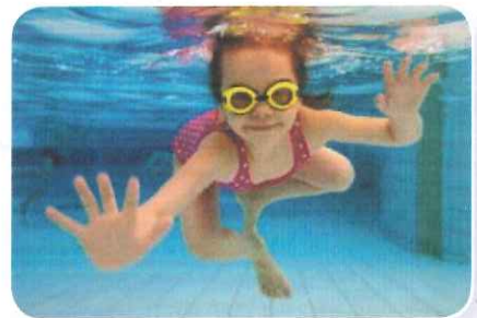
Onder water kun je geluiden heel goed horen.

De holle ruimte in een gitaar heet de klankkast. De klankkast versterkt het geluid van de snaren. Als je de snaren strakker maakt, krijg je een andere toon. Je stembanden zijn ook een soort snaren. Je kunt ze spannen of ontspannen. Bij slappe stembanden heb je een lage toon, bij strakke stembanden een hoge. Geluid verplaatst zich in golven. Die geluidsgolven worden door bijvoorbeeld lucht, water of metaal naar een andere plek gebracht. Lucht, water en metaal zijn geleiders. Door de lucht komt een geluidsgolf in je oor. Daar botst hij tegen je trommelvlies. Dat is een soort vel, net als op een trommel. Het trommelvlies geeft de trilling door aan het slakkenhuis. De haartjes in het slakkenhuis geven het geluid door aan je hersenen.