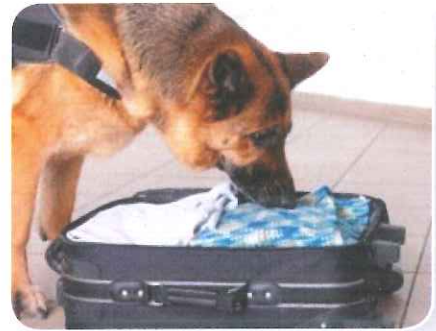
Honden met een lange neus ruiken het best.

Zintuigen zijn de organen in je lichaam waarmee je kunt waarnemen. De zintuigen geven informatie van buiten door aan je hersenen. Je hebt vijf zintuigen: met je oren kun je horen, met je ogen kun je zien, met je neus kun je ruiken, met je mond kun je proeven en met je huid kun je voelen of tasten. Sommige dieren hebben een neus op steeltjes of ruiken met hun tong. Honden kunnen met hun neus een miljoen keer beter ruiken dan mensen. Zij kunnen heel goed een geurspoor volgen. Honden zijn wel kleurenblind. Ze kunnen het verschil tussen rood en groen niet zien. Honden horen geluiden met hogere toonhoogtes dan mensen. Ook roofvogels horen geluiden op een hoge toonhoogte. Walvissen horen juist geluiden op een lage toonhoogte.