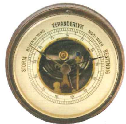
Een barometer laat zien wat voor weer het de komende dagen wordt.

Je kunt het weer voorspellen met een barometer. Het pijltje op de barometer geeft aan wat voor weer het wordt. Je kunt ook naar de wolken kijken. Bij veegwolken en stapelwolken blijft het vaak mooi weer. Grijs schapjeswolken zorgen voor neerslag, witte schapjeswolken voor beter weer. Zie je golfwolken dan wordt het somber weer.