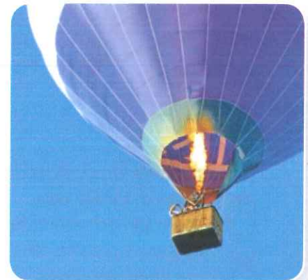
Een gasbrander maakt de lucht in de ballon warm.

De zon verwarmt de aarde. De lucht boven de aarde wordt warm en stijgt op. Zo ontstaan warme luchtballen. Dat noem je thermiek. Een vogel en een zweefvliegtuig maken gebruik van de thermiek. Ze zweven op de warme luchtstroom. Een heteluchtballon maakt ook gebruik van warme lucht, maar niet van thermiek. Er wordt koude lucht in de ballon geblazen. Met een gasbrander maak je die lucht warm. Een parachute is een valschermdat gevuld wordt met lucht. De lucht remt de parachute af, zodat je langzaam naar beneden zweeft. Een helikopter kan recht omhoog, recht omlaag en zelfs achteruit vliegen. Zijn wieken draaien heel hard rond. Een jumbojet heeft sterke straalmotoren. Zijn vleugels lijken op die van een vogel.